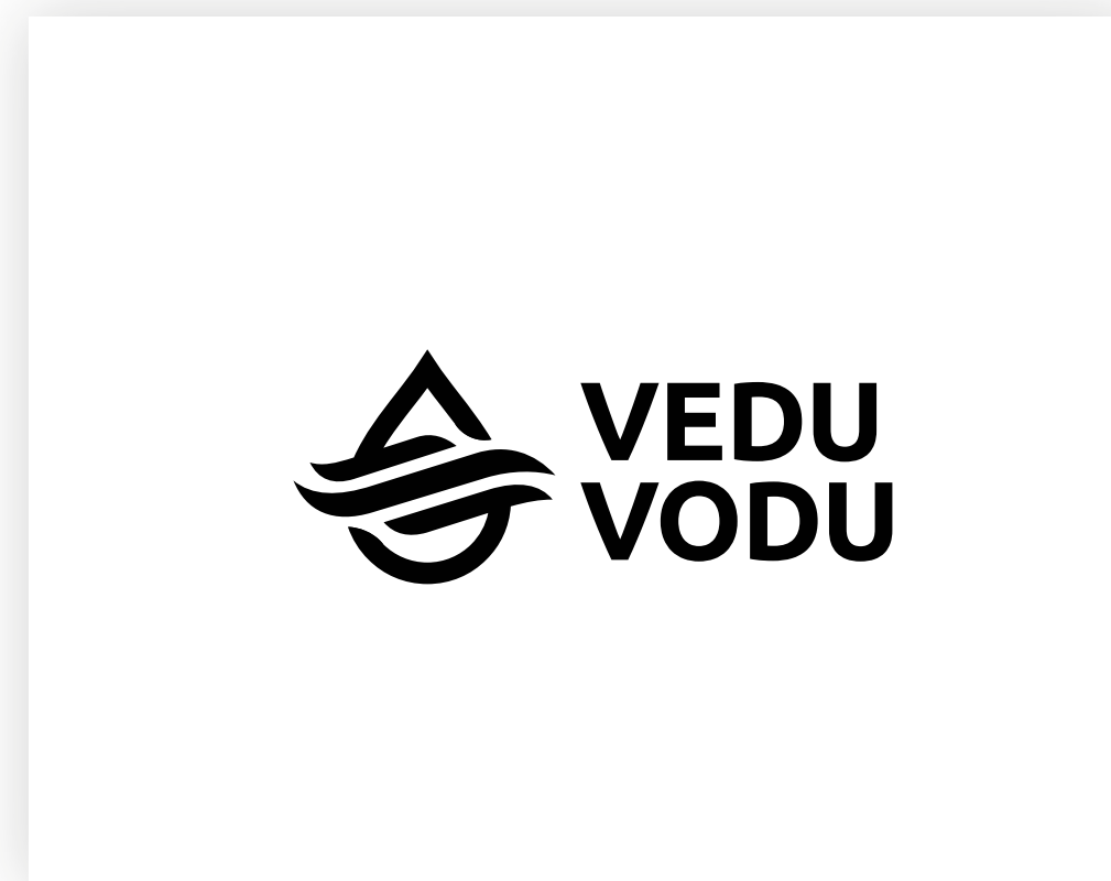
Černé na bílém pozadí