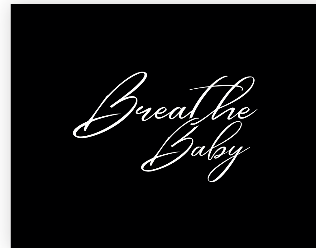
Bílé na černém pozadí