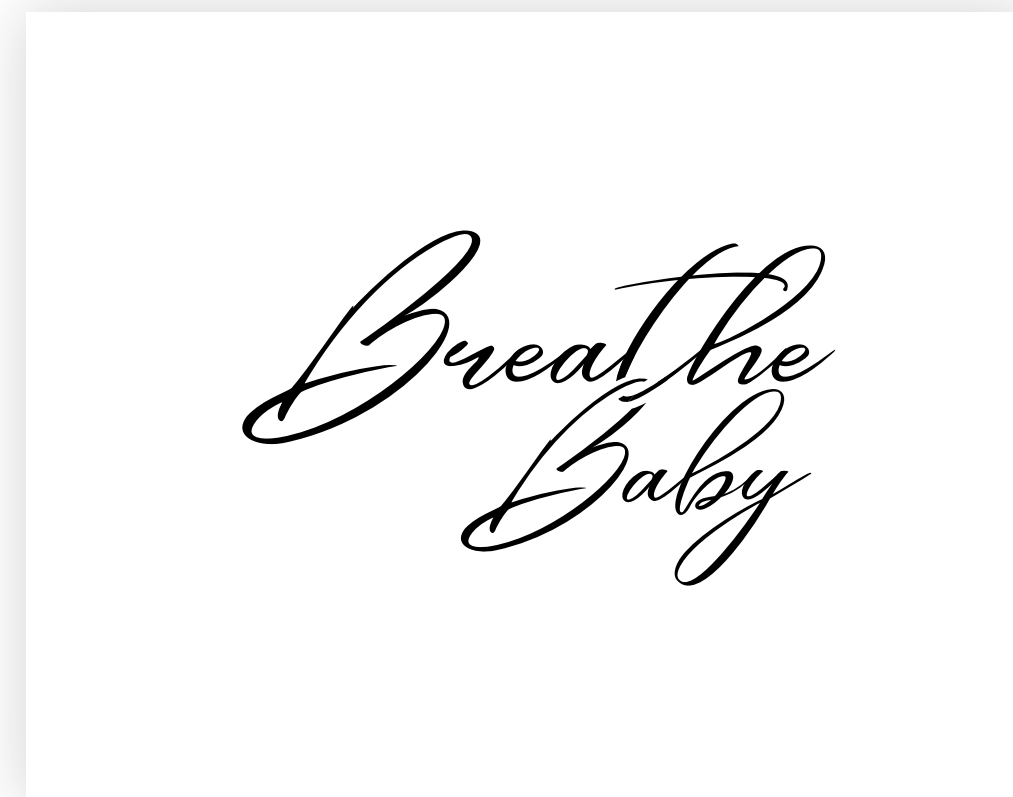
Černé na bílém pozadí