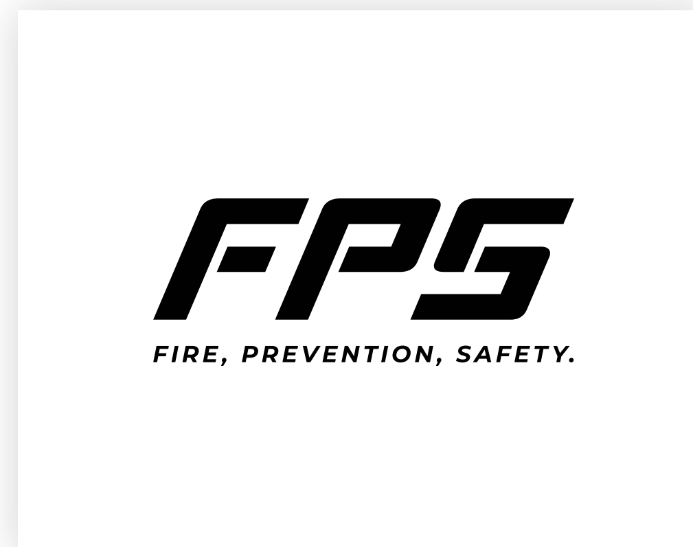
Černé na bílém pozadí